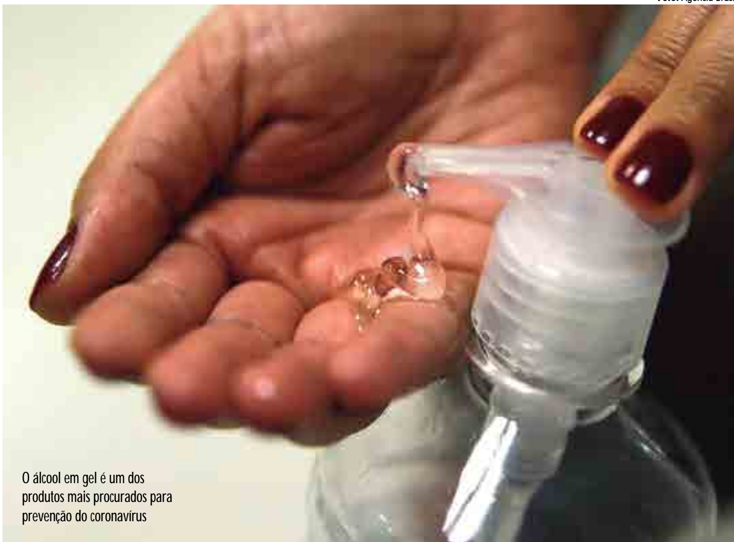
O álcool em gel é um dos produtos mais procurados para prevenção do coronavírus

“Tivemos denúncias que estavam retendo máscaras para cobrar preços altos. Nossa fiscalização foi às ruas e o que verificamos foi o mercado farmacêutico já desabastecido. Quanto aos preços, estamos monitorando e caso fiquemos com dúvidas quanto a eventuais abusos, abriremos procedimento para averiguar”, explicou Késsia.