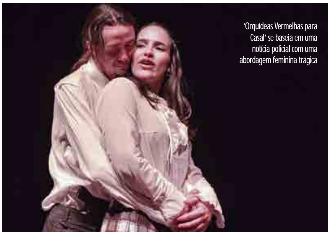
'Orquídeas Vermelhas para Casal' se baseia em uma notícia policial com uma abordagem feminina trágica