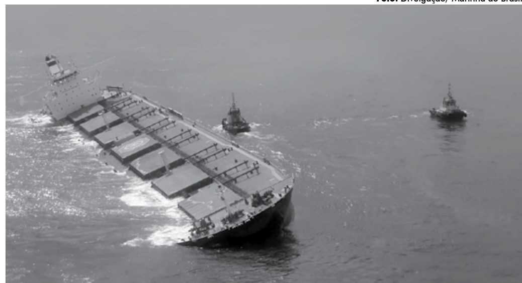
O incidente ocorreu em 24 de fevereiro, após a embarcação deixar o Terminal de Ponta da Madeira, em São Luís (MA)