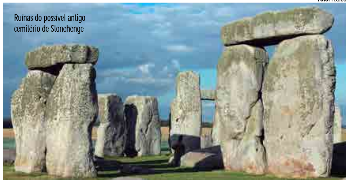
Ruínas do possível antigo cemitério de Stonehenge

famosos, como o Cemitério da Recoleta na Argentina, o Cemitério Nacional de Arlington nos Estados Unidos, as Ruínas de Stonehenge e a Abadia de Westminster, ambos na Inglaterra, o Père Lachaise na França, entre diversos outros, necrópoles como o Cemitério da Consolação em São Paulo e o São João Batista no Rio de Janeiro atraem milhares de visitantes todos os anos, que transitam pelas suas alamedas, jazigos e coroas de flores.