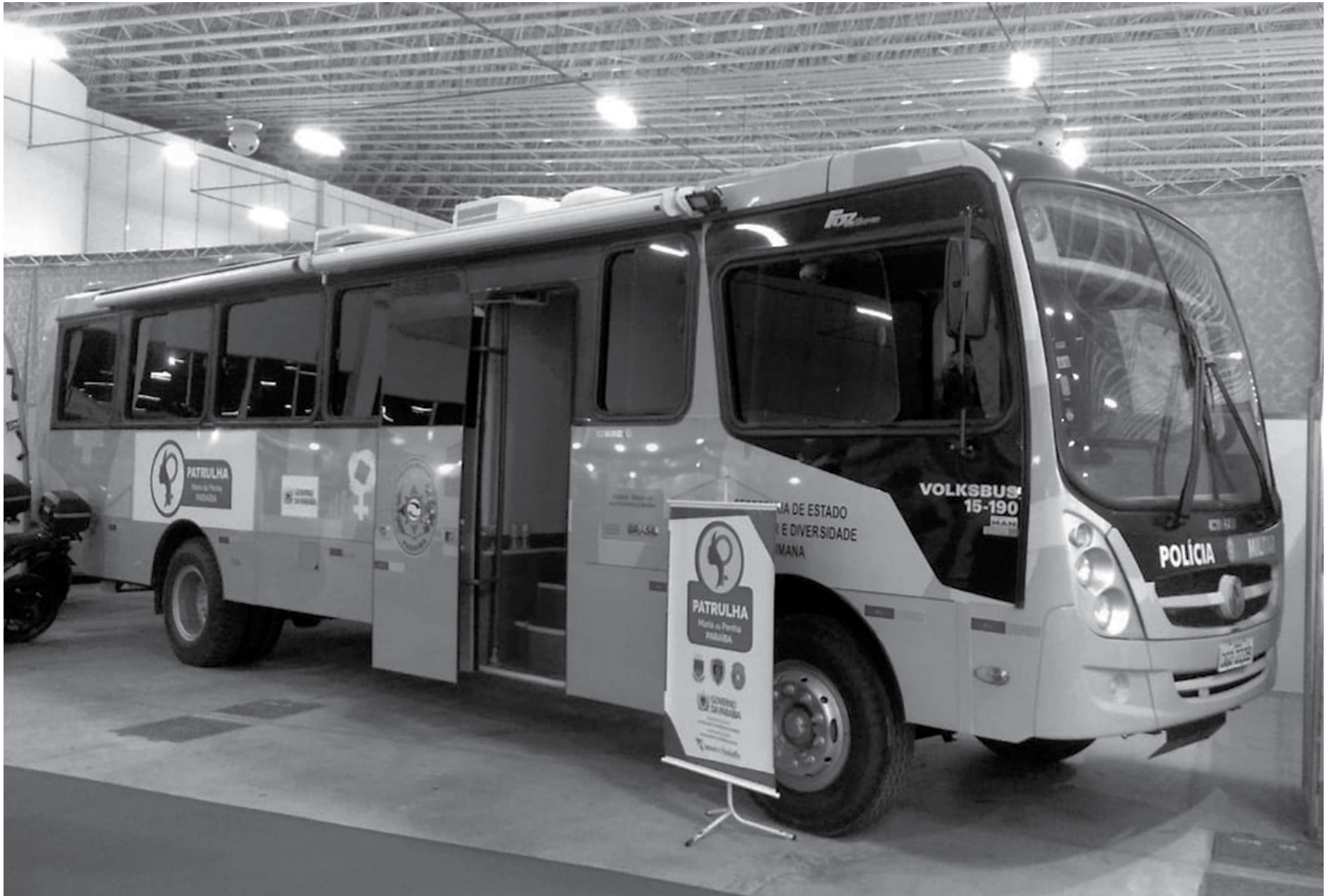
Em comemoração ao Dia Internacional da Mulher, mais de 50 atividades serão realizadas durante o mês envolvendo o trabalho interinstitucional de vários órgãos do governo

Entre as ações que serão lançadas, será divulgada a formação dos profissionais que atuarão na ampliação do Programa Integrado Patrulha Maria da Penha, que atua na prevenção e acompanhamento de mulheres em situação de violência doméstica e familiar monitorando o cumprimento das medidas protetivas de urgência e medidas judiciais contra os agressores. O programa, que começou em 27 cidades da Paraíba, incluindo a Região Metropolitana de João Pessoa, será expandido para mais 106 cidades a partir do segundo semestre. O programa funciona por meio de parceria entre a Secretaria da Mulher e da Diversidade