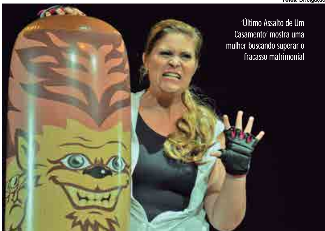
'Último Assalto de Um Casamento' mostra uma mulher buscando superar o fracasso matrimonial

A trama se baseia em uma notícia policial com uma abordagem feminina trágica: enfrentando um câncer em fase terminal, uma mulher encontra inusitada solução para salvar e manter o seu casamento, colocando, em prática um plano em que o marido se case com a sua irmã caçula.