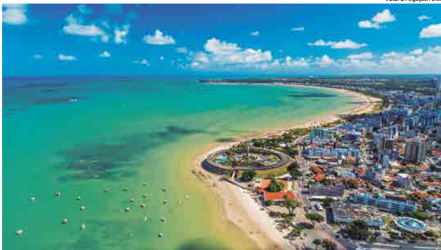
A capital (foto) é a principal porta de entrada de turistas para o Estado, porém os atrativos seguem pelo interior, em ambientes históricos e culturais