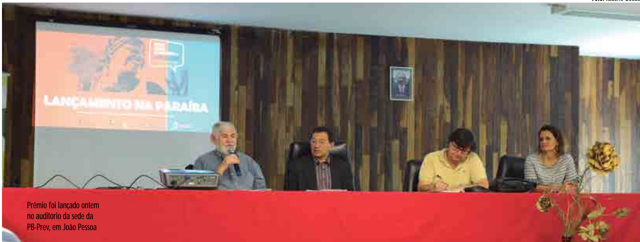
Prêmio foi lançado ontem no auditório da sede da PB-Prev, em João Pessoa